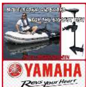
Biggest fish with Yamaha