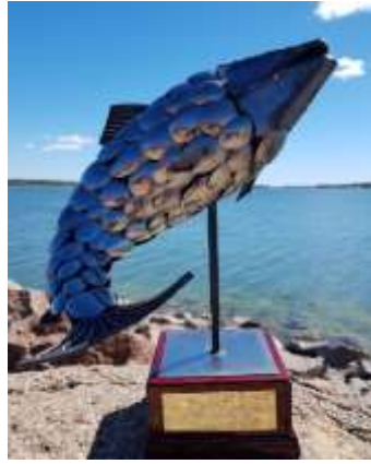
Trophy for best Nation!

På http://www.trollingtraff.ax/resultat/ hittas alla resultat och där kan invägningen även följas med i real tid. All results are available at http://www.trollingtraff.ax/en/results/ and the weigh-in can also be monitored in real time.