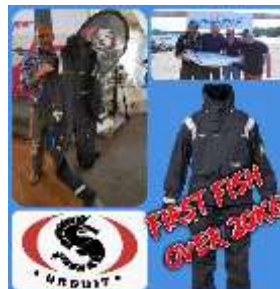
First fish over 20kg with Ursuit