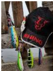
Fish closest to 10kg with Rhino