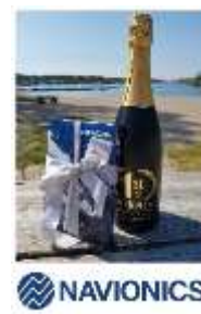
28 th fish with Navionics