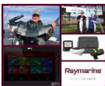
Best team with Raymarine

Lax och öring som fångas under tävlingsperioden som överstiger minimimåttet 60 cm är godkänd fångst. Varje lag får väga in max 4 st fiskar/ dag.