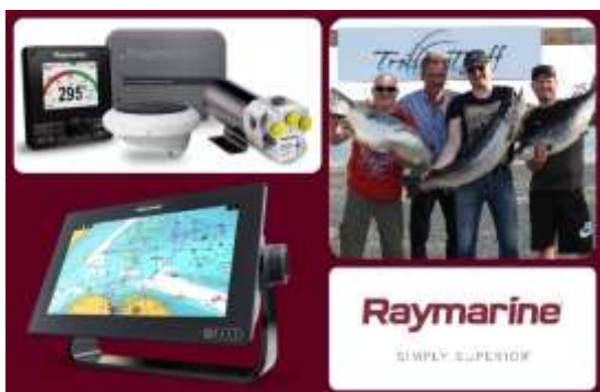
This year's main prize comes from Raymarine

Lax och öring som fångas under tävlingsperioden som överstiger minimimåttet 60 cm är godkänd fångst. Varje lag får väga in max 4 st fiskar/ dag.