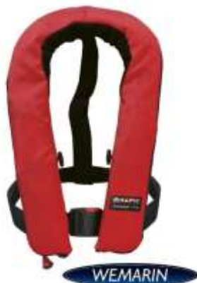
Daily prizes for the biggest fish from Wemarin