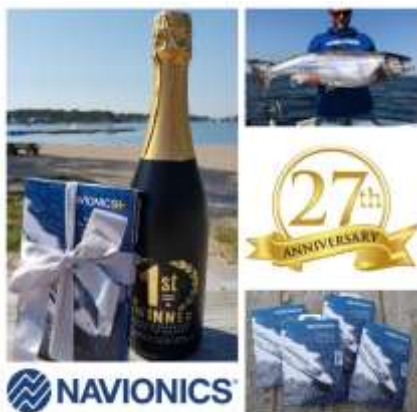
Daily prizes for the best team and 27th anniversary in co-operation

Prisutdelning: Om pristagarna inte dyker upp (om inget annat är överenskommet) kan deras pris att gå förlorade och ges vidare till nästa pristagare (gäller alla dagar). Om tävlingen måste avbrytas utses vinnaren utgående från genomförda fiskedagar/ timmar. För att en dags skall räknas som en fiskedag skall den totalt bestå av min. 4h fiske. Outdelade pris kan överföras till nästa tävlingsdag och/eller lottas ut bland deltagarna.