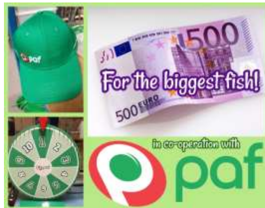
Main prize for the biggest fish and also a wheel of fortune in co-operation with PAF

Grön flagga delas under torsdagens och fredagens prisutdelning ut till teamet som leder tävlingen (= största totala mängd fisk). Flaggan är synligt hissad på lagets båt följande tävlingsdag.