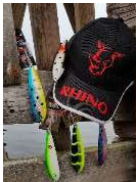
The fish closest to 10kg in co-operation with Rhino