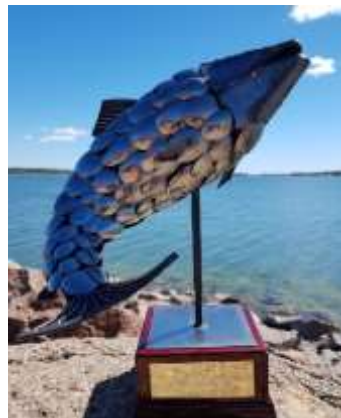
Trophy for best Nation!