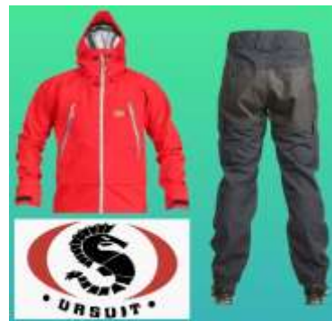
Märket- dress from Ursuit to the first fish over 20kg